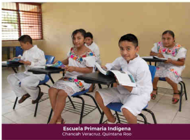
Escuela Primaria Indígena Chanchah Veracruz, Quintana Roo.